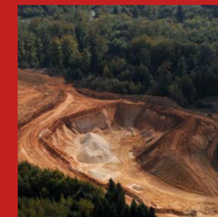
EXPLOITATION DE MATÉRIAUX ALLUVIONNAIRES Carrière de Tanconville (54)