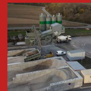
PRODUCTION DE PRÈS DE 30 000 M 3 DE BÉTON FEHR BÉTON Environnement à Strasbourg (67)