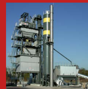
PRODUCTION MOYENNE DE 250 000 T D'ENROBÉS BITUMINEUX SEMAROUTE à Strasbourg (67) et à Louvigny (57), EST ENROBÉS à Sélestat (67)