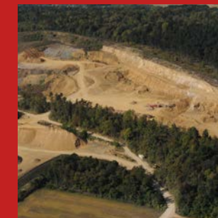
EXPLOITATION DE MATÉRIAUX CALCAIRES Carrière de Bouxières sous-Froidmont (54)