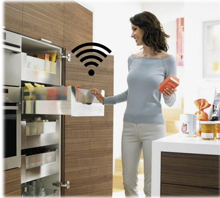
Gamme d'objets connectés