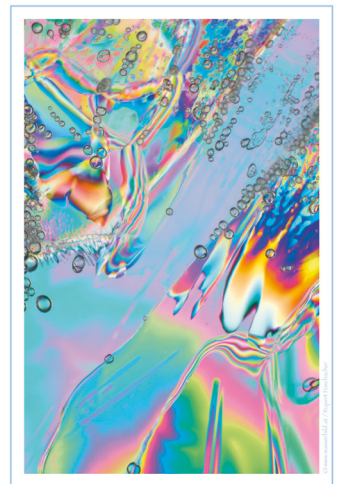
Leitungswasser aus Stuttgart mit VortexPower® Spring